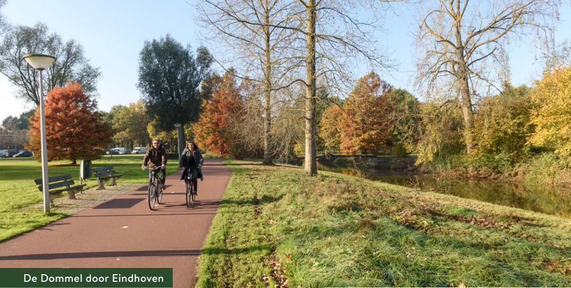
De Dommel door Eindhoven