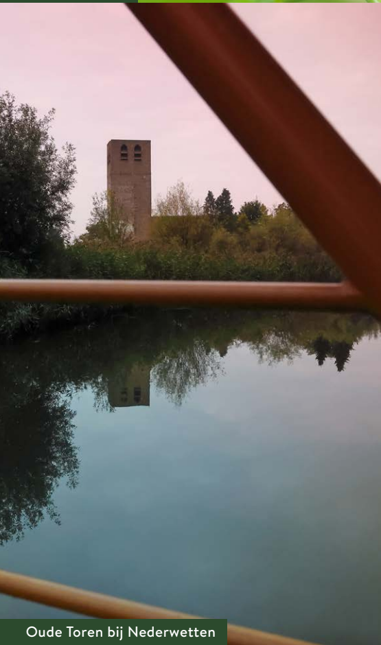
Oude Toren bij Nederwetten